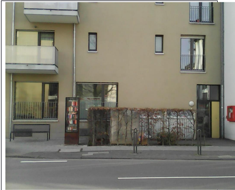
Rechts der Eingang Alte Wipperfürther Straße 59 zum GAG – Gemeinschaftsraum Behindertengerechter Eingang Caumannsstraße 21