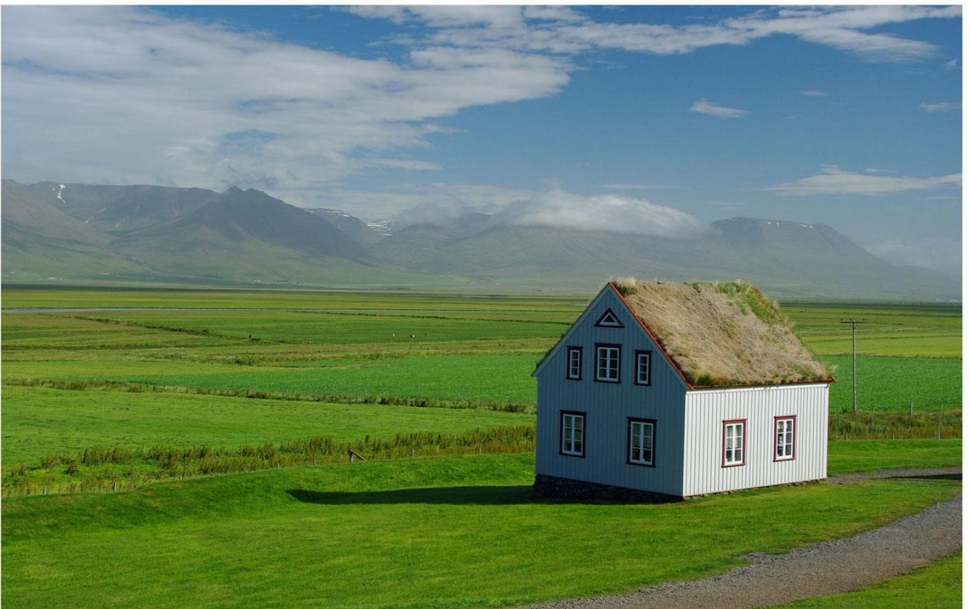
„Frühling in Island“