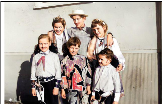
Karneval 1957 in Buchheim