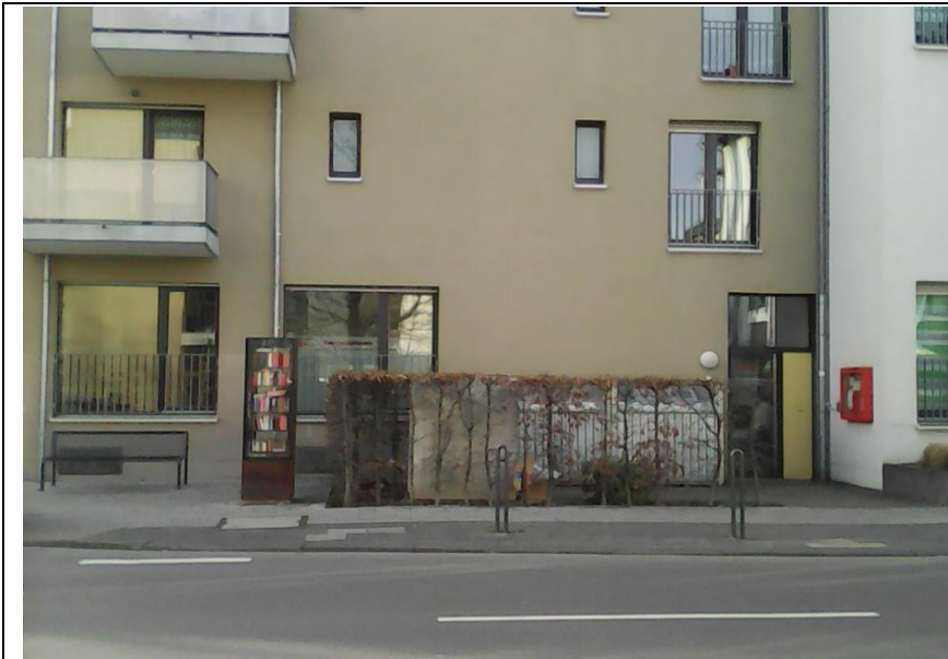
Rechts der Eingang Alte Wipperfürther Straße 59 zum GAG - Gemeinschaftsraum. Behindertengerechter Eingang Caumannsstr. 21. Rechts im roten Schaukasten stehen verschiedene Informationen. – Links der Bücherschrank. Ab- und Ausgabeplatz für Romane und Kinderbücher.