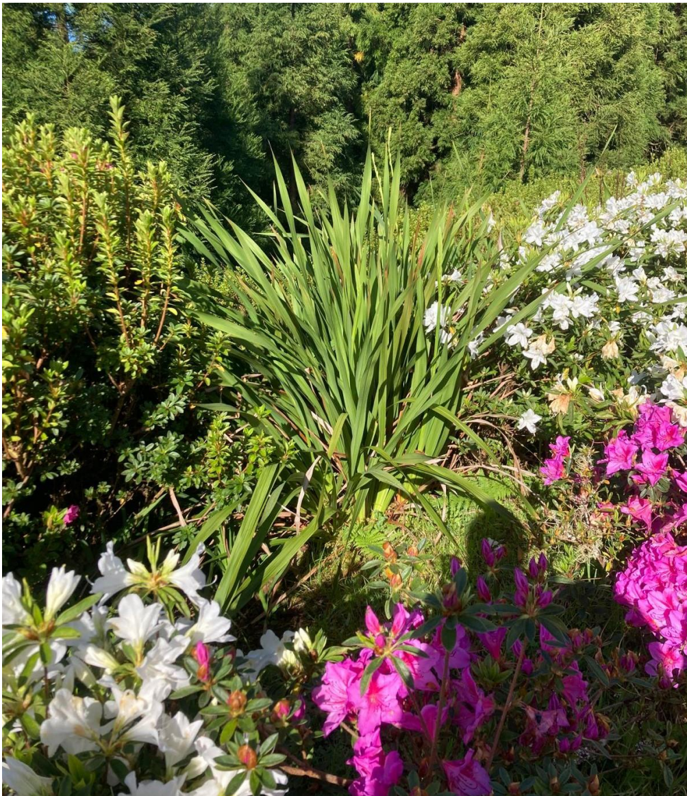
(Azoren, Insel des ewigen Frühlings)